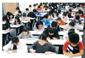
試験開始の合図で一斉に問題に取り掛かります。