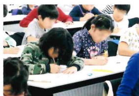
低学年は先生のサポートの中、じっくりと問題に取り組みます。